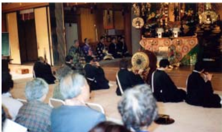
蔵本通支坊は雅楽の生演奏で法要

恒例になった記念撮影。「もっと内側へ寄ってえや。外側は顔が広がって写るんじやと！」