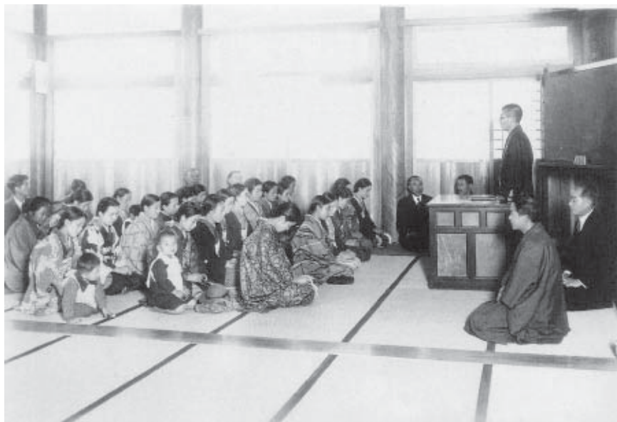
戦没軍人未亡人慰問講話会・一九三九(昭和十四年)十一月 於三津田支坊か? (『呉の歩み』より)