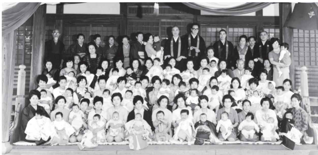
1969 (昭和44) 年 第3回初参式の写真。赤ちゃんは現在37歳前後に。