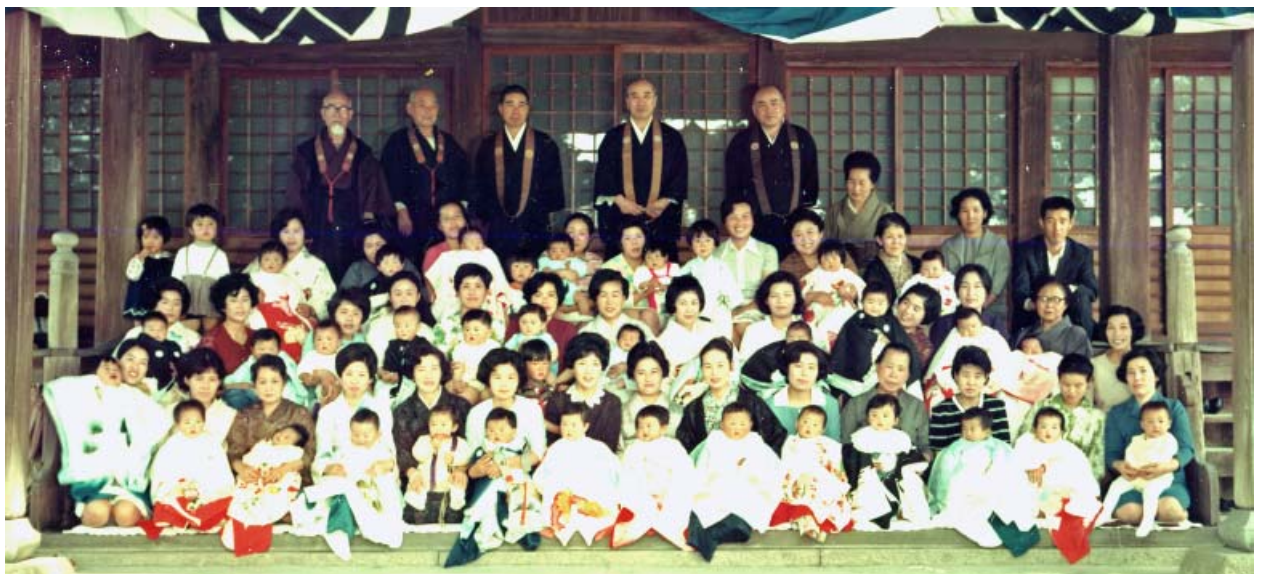
1970（昭和45）年 第4回初参式の写真。赤ちゃんは現在37歳前後に。