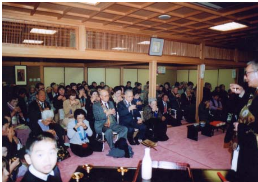
修正会おつとめ後のご流盃の様子(長ノ木本坊)。