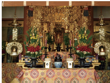
蔵本通支坊の荘厳なお飾り