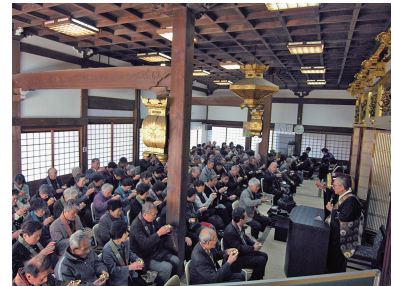
長ノ木本坊では、仏教では珍しいお酒を頂く行事「ご流盃(親鸞さまのお流れを皆で頂戴する行事)」もあります。