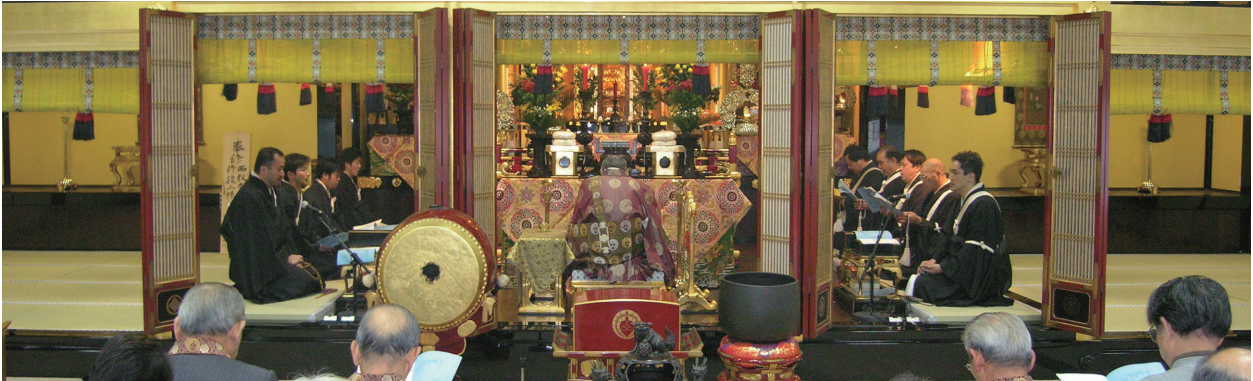
ご満座 1 6 日朝席は、和庄明法寺住職、西教寺住職・法務員・衆徒（西教寺に所属する僧侶）が出勤予定